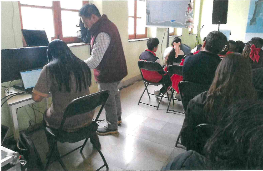
Fotografía de Evento Transmitido