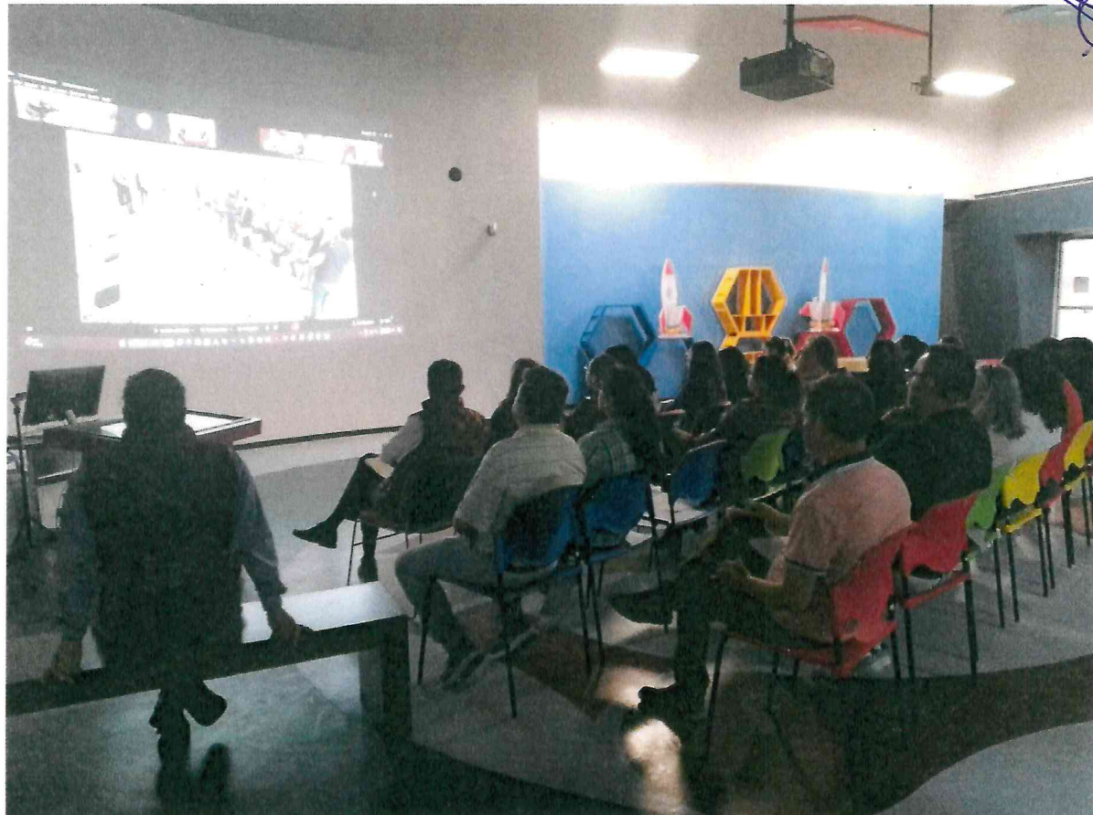
Atención a visitantes en el Centro de Cultura Digital