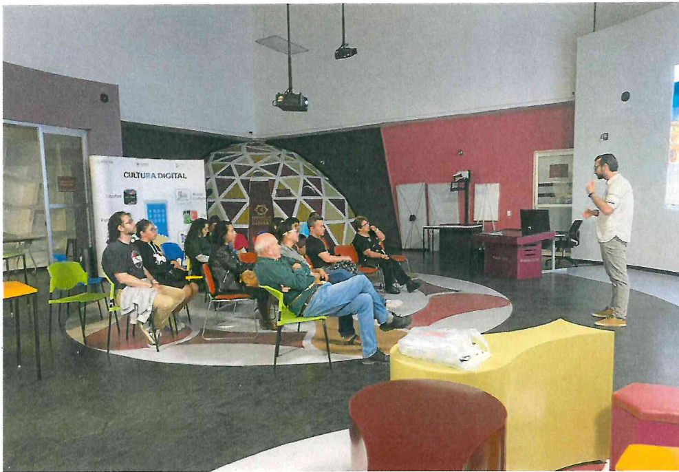
Función de cine francés.