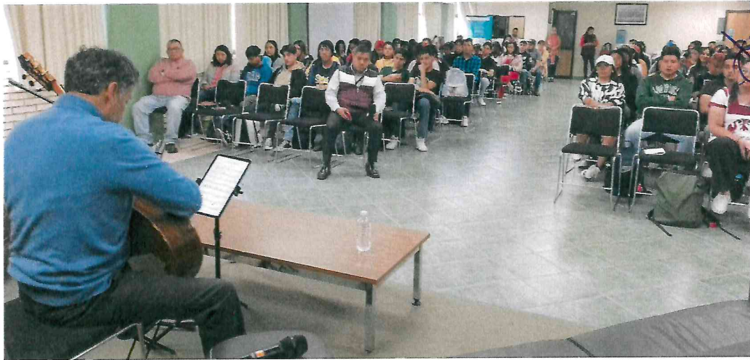
Visita al ITESA con motivo de la FLIJH2024