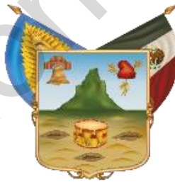
Estado Libre y Soberano de Hidalgo