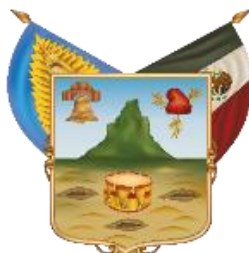
Estado Libre y Soberano de Hidalgo