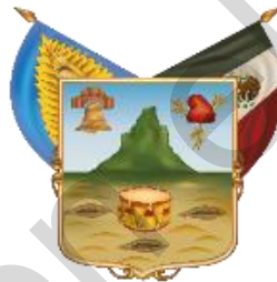
Estado Libre y Soberano de Hidalgo