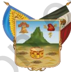
Estado Libre y Soberano de Hidalgo