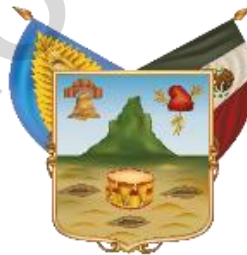
Estado Libre y Soberano de Hidalgo