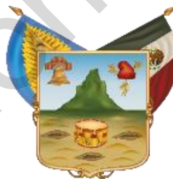
Estado Libre y Soberano de Hidalgo