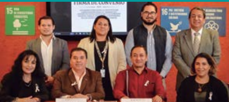
San Agustín Tlaxiaca, Hgo.

Rä ICATHI n'e rä CEDSPI, bi hmeyä n'a rä nkohi gä m'efi